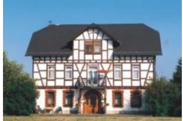
ehemaliger (Kleinbahn-)Bahnhof Holzhausen

Heute rollt die Nassauische Kleinbahn nur noch im Maßstab 1:87 im Regionalmuseum, das den einst bedeutendsten Verkehrsträger des Blauen Ländchens eine Abteilung gewidmet hat. Hier kann man u.a. den Kleinbahnhof Miehlen in einer hübschen Modelleisenbahnanlage bewundern. Noch sehr viel mehr erfahren Sie in Winfried Otts reich illustriertem Buch „Einsteigen bitte! – Erinnerungen an die Nassauische Kleinbahn“ , das im Museumslädchen erhältlich ist.