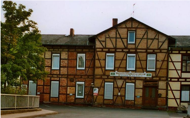
ehemaliger (Zentral-)Bahnhof Nastätten